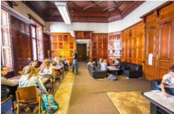
（IES Abroad 维也纳中心学生休息室）