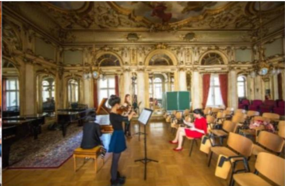
（IES Abroad 维也纳中心音乐大厅）